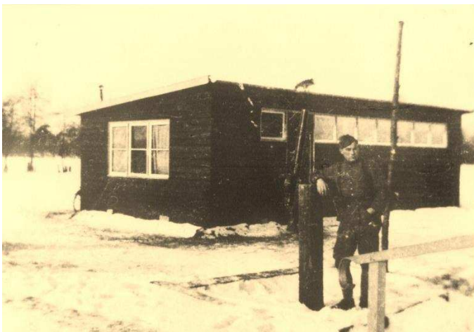
Ruurlo winter 1939/40. Arie de Groot bij object 2201 de brug over de Hissinkbeek te Ruurlo. Deze barak was het woonverblijf voor de soldaten die dit object moesten bewaken.

Arie de Groot is in 1938 opgeroepen voor militaire dienstplicht. En werd op 11 april 1939 ingedeeld bij het 16 R.I. Na zijn opleiding in Amersfoort werd hij overgeplaatst naar Naarden. Toen de voormobilisatie begon, werd het 16 R.I. overgeplaatst naar de Achterhoek. Arie de Groot kwam in Ruurlo bij de 2de compagnie 16de grensbataljon. Dit lag verspreid in de omgeving van Zutphen, om bruggen en wegversperringen te bewaken.